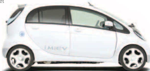
De I-Miev wordt vanaf december verwacht bij de Mitsubishi-dealer.