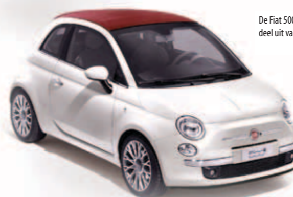
De Fiat 500 maakt vanaf heden ook deel uit van onze kortetermijnvloot